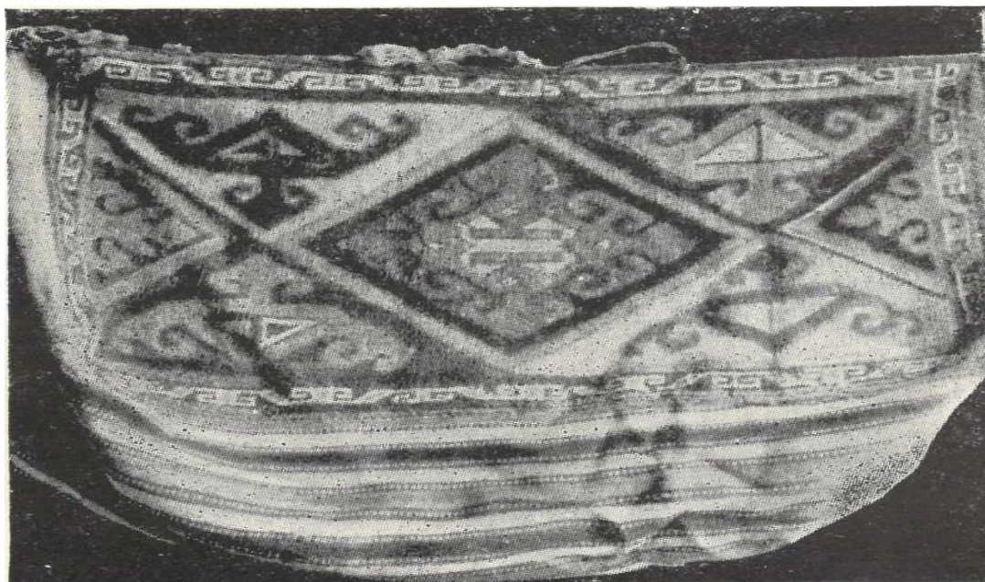
1-расм. Ўзбек тома уруғи гиламдўзлари томонидан тайёрланган хўржун

Бу борада тадқиқотчи В.Г.Мошкова ўз асарларида А.Д. Гребенкин, И.И.Зарубин, М.С. Андреевларнинг маълумотларига таяниб, XIX аср туркманларнинг қозоёқли, бўгажалли, қонжиғали, ойтамғали уруғлари ўзларини туркманларнинг “така” уруғига мансуб бўлганлиги туркман уруғларининг миллий ўзига хослиги, айниқса гиламчилик, каштачилик санъати асори атиқаларига катта қизиқиш билан муносабатда бўлганлигини ёзади. Муаллифнинг фикрича, ушбу уруғларнинг моддий мадангياجтида ва кундалик ҳаётида айниқса Нурота гиламлари муҳим ўрин тутди, деб ёзади. [10, - С. 135-158, 238. Унинг уқдиришича, Нурота гиламлари воҳада яшовчи “олти ота туркман” ва “беш ота манғишлов” туркманлардан ташқари найман, туёқли, тукман, юз, қирқ, сарой каби бир қанча уруғларига кирувчи аҳоли ҳам тайёрланган.